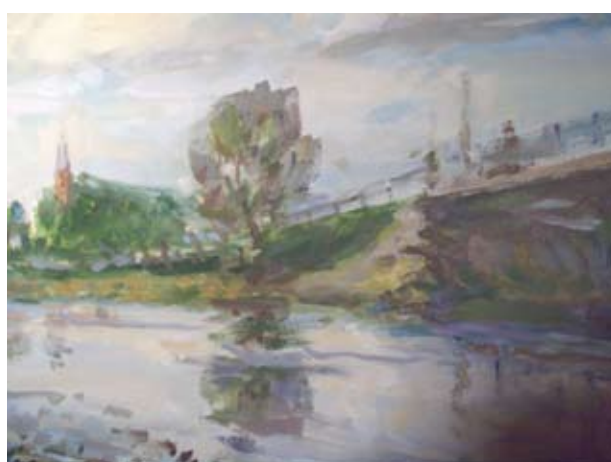
Senasis Šventosios tiltas prie Dusetų.