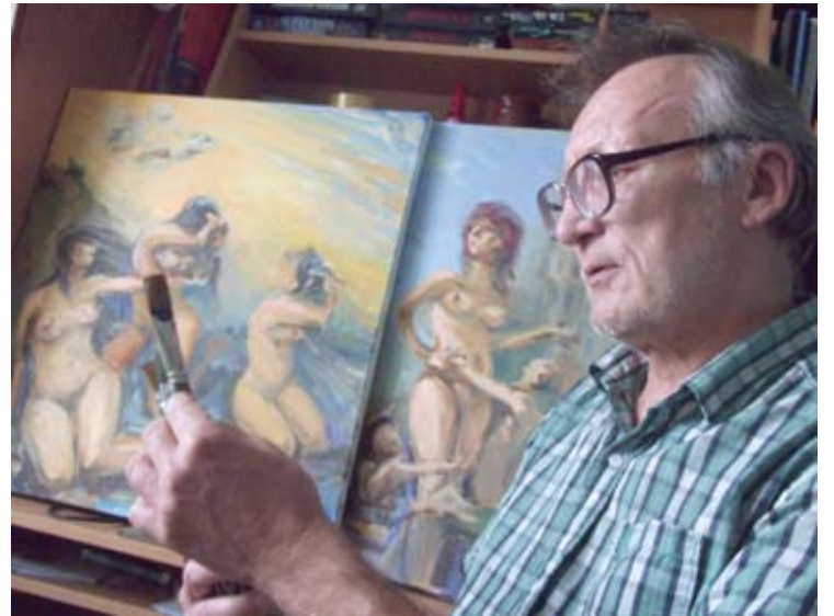
Dailininkui kartais tenka išpildyti ir ypatingus meno mylėtojų pageidavimus.