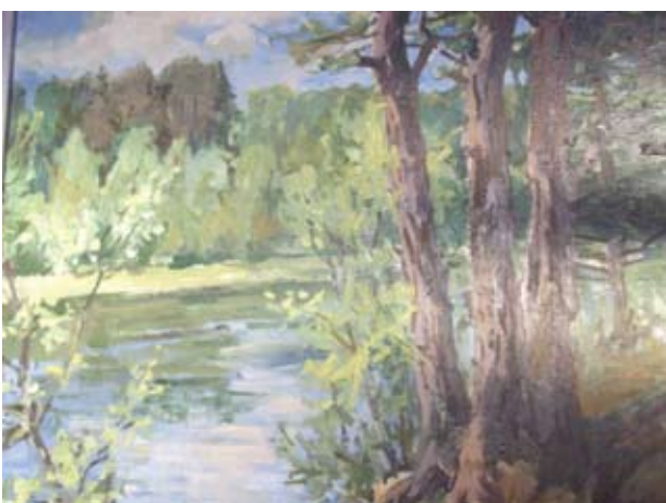
Šventoji ties Anykščiais.