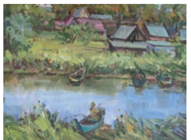
Meškeriotojas ties Užpaliais.