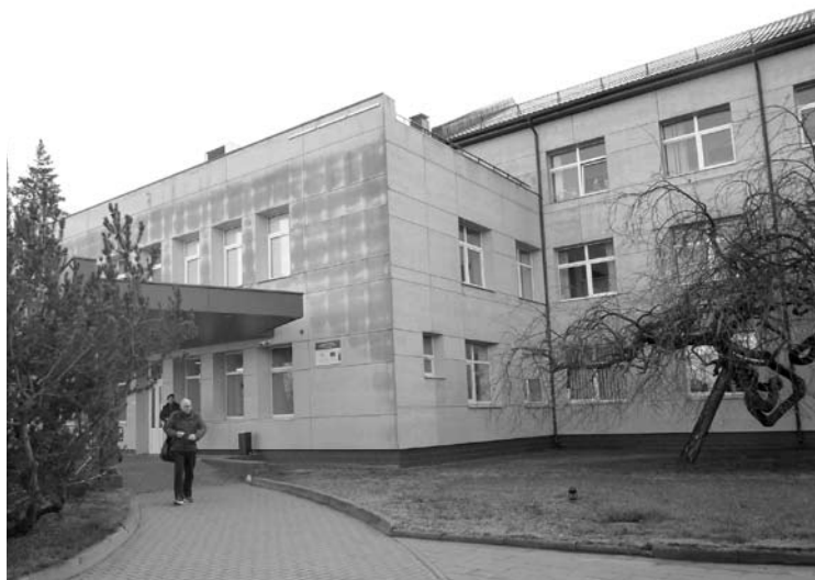
Koronavirusu susirgo Ukmergės ligoninės gydytojas, todėl kai kurie ligoninės skyriai uždaromi.

Svarstoma, jog iki kovo 30-osios paskelbtas karantinas bus pratęstas iki gegužės 1-osios. Būtent taip, per keletą saviizoliacijos mėnesių, situacija jau beveik suvaldyta Kinijoje, kur virusas registruotas dar 2019 – ujų gruodį.