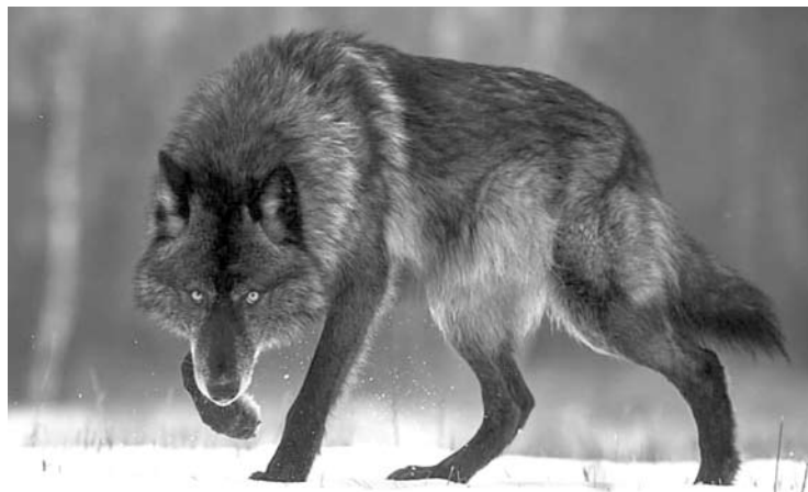
Ūkininkai turės daugiau galimybių apsaugoti gyvulius nuo vilkų.

Šiemet kaip niekad Anykščių rajone vilkai anksti pradėjo medžio-