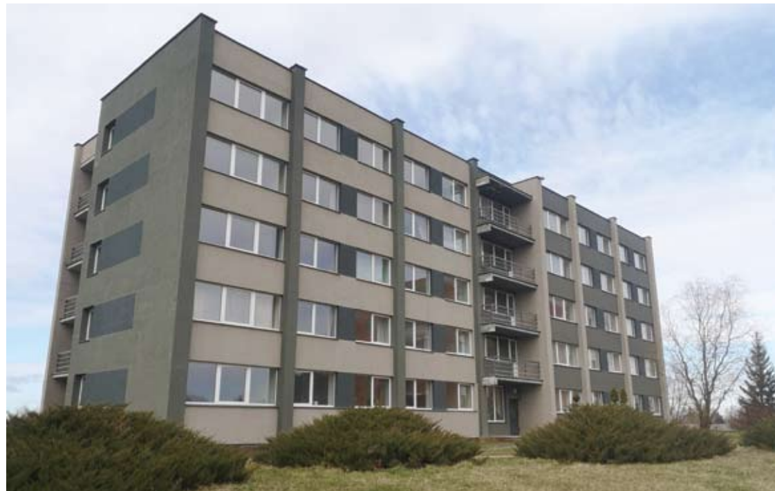
Anykščių technologijos mokyklos bendrabytyje sudaryta galimybė izoliuotis apie pusė šimto gyventojų.

Pirmadienį, kovo 16 dieną, į posėdį susirinkusi Anykščių rajono savivaldybės Ekstremalių situacijų komisija nusprendė, kad gyventojai, kurie įtariami užsikrėtę koronavirusu ar turėjusieji sąlytį su galimai užsikrėtusiu šiuo virusu asmeniu, bet neturi galimybės izoliuotis savarankiškai, tai galės padaryti Alantos technologijos ir verslo mokyklos Anykščių filialo bendrabytyje.