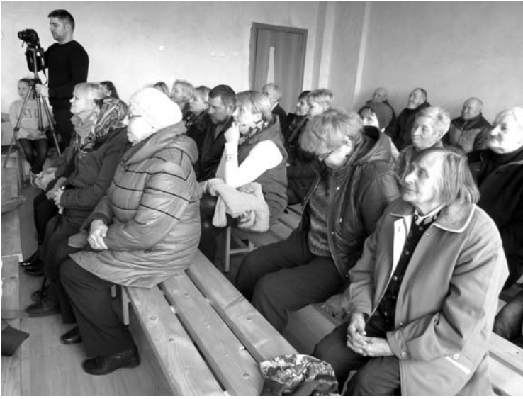
Staškūniškėičiai Kovo 11-ąją klausėsi koncerto ir paskaitos.